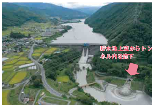
写真-4 土砂バイパス(洪水の一部を貯水池上流端付近からダム下流にバイパス) 5)