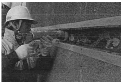
写真-1 充填工法によるアーチ式コンクリートダム打継面部の漏水対策 6)

ダムの有効活用を図る方法には種々のものがあるが、ダム貯水池を（1）永く使う、（2）賢く使う、（3）増やして使う、（4）ネットワークで使うことを推進することが要求される 3) 。この中で、「永く使う」、つまり「長寿命化」という観点からは、ダム施設の維持管理を適切に行うことにより、ダムの安全性および機能を長期にわたり保持するため、日常点検における巡視・点検・修繕等に加えて、ダムを構成する設備ごとの中長期的な維持管理方針を定めたダムの長寿命化計画を策定し、必要に応じて保全対策を実施してきている 4) 。また、貯水池の機能を確保するために堆砂対策が必要なダムでは、堆積土砂の掘削・浚渫、貯砂ダムの