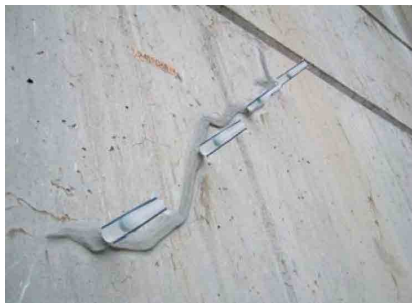
写真-3 含浸材塗布によるヘアクラックの補修状況 10)