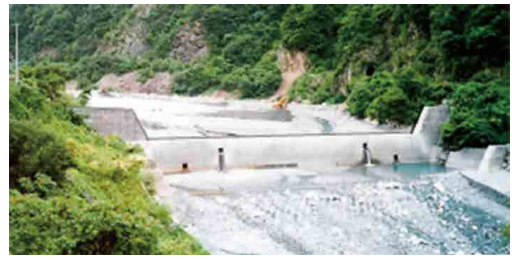
写真-7 貯砂ダム（土砂を捕捉し掘削） 5)