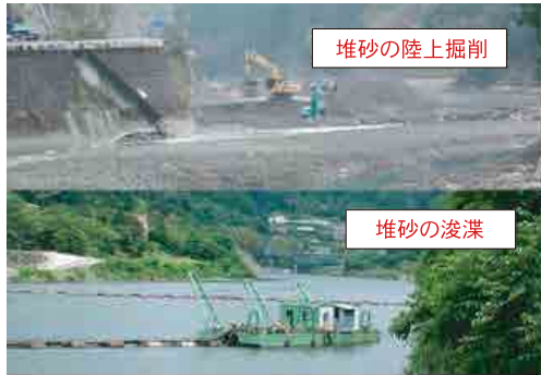
写真-6 汎用機械による堆砂の掘削と浚渫 5)