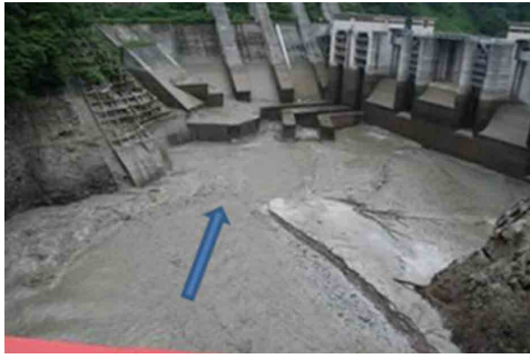
写真-5 土砂フラッシング・スルーシング（貯水位を低下させて土砂を放流） 5)