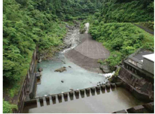
写真-8 ダム直下流の置土（洪水時の放流で侵食されて流下） 5)

河道に放出される。下流域の土砂環境の改善が期待される一方で、流量と土砂量の関係が、ダムがない場合と同様にはならないことからその影響が懸念される。このため、対策の実施に当たっては、土砂流下の影響を予測するとともに、下流河道環境が安定化するまで河道変化や生物の状況をモニタリングし、必要に応じて操作方法にフィードバックすることが望まれている。